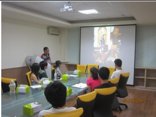
5.帶著愛心去旅行－印度國際志工