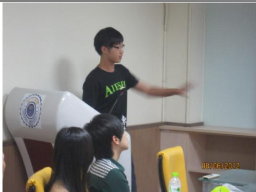
7. AIESEC 國際經濟商管學生會